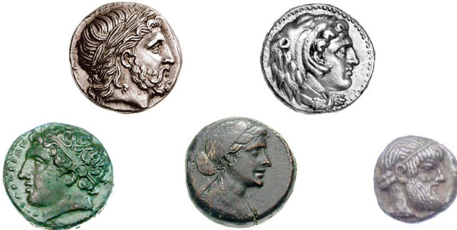
MONEDAS CON EL RETRATO DE FILIPO II, ALEJANDRO MAGNO, TEMISTOCLES, AGATOCLES Y CLEOPATRA.