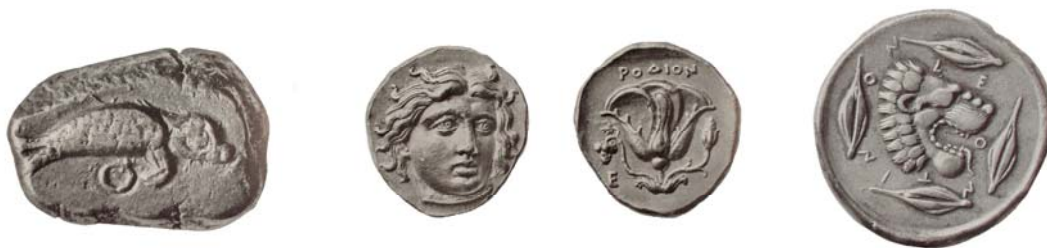
TIPOS PARLANTES: FOCAS: Representación de una foca, RODAS: con la imagen en su reverso de una rosa que es lo que significa su nombre, LEONTINOS: con un león rodeado por cuatro semillas de trigo.

Pero los tipos podían utilizarse no sólo como escena decorativa de la moneda, sino también para no tener que introducir leyendas en las piezas pues ya lo haría la escena. Es lo que se denomina como tipos parlantes en los que el nombre del elemento representado coincide con el nombre de la ceca. Hubo ciudades que utilizaron este método únicamente en sus primeras emisiones como es el caso de Focas, pero hay otras como Rodas en el que la imagen de la rosa representada en sus piezas, se mantuvo hasta el final de sus emisiones a finales del período helenístico y hubo otras que eligieron utilizar este método en épocas más tardías como es el caso de Leontinos Trapezunte.