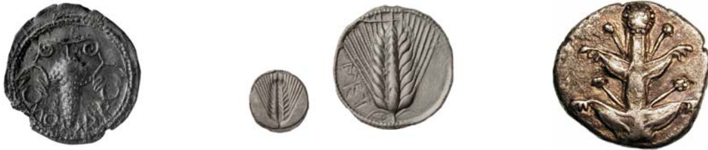
MONEDAS DE NAXOS con una vid, METAPONTO con una espiga y CIRENE con la planta del silphium.

facetas económicas más destacadas de cada polis. En ocasiones gracias a las monedas hemos podido conocer el tipo de uva cultivado en ciertas regiones o incluso la imagen de especies vegetales que hoy día están extintas, es el caso del silphium , una planta que abundaba en el norte de África y que sus propiedades medicinales le hacían un elemento muy demandado sobre todo por las tropas en las campañas militares.