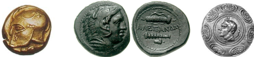
MONEDAS DE JONIA, ALEJANDRO MAGNO Y ANTIGONOS GONATAS.

Sin duda alguna, uno de los temas más interesantes son las representaciones de armas, de los que tenemos un amplio repertorio en el que cabe destacar una ausencia, la espada que apenas aparece, mientras que armas asociadas a divinidades como el arco de Apolo o sobre todo la clava y el arco de Heracles los encontramos en innumerables monedas. Otro de los casos es el aprovechamiento de la forma monetar para representar un objeto de igual formato, como el escudo. Este es el caso de los tetradracmas acuñadas en Macedonia desde el siglo III a.C., hasta el comienzo de las acuñaciones romanas.