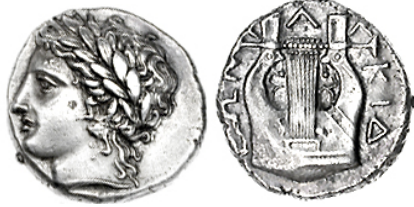
OLINTO CON APOLO EN EL ANVERSO Y UNA LIRA EN EL REVERSO

Los instrumentos musicales es otro de los temas utilizados para decorar las monedas. Sin duda la lira, muy relacionada con el culto a Apolo, es la imagen más frecuente. Aunque en ocasiones en escenas dionisíacas también encontramos escenas de sátiros tocando la flauta.