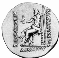
Fig. 2. Agatocles en honor de Alejandro (plata)