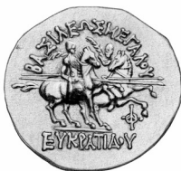
Fig. 4. Eucrátides I (plata unilingüe en griego)