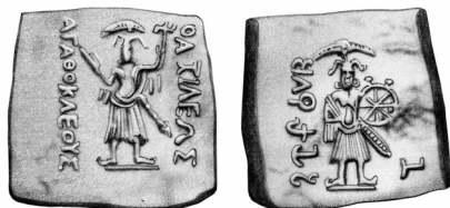
Fig. 6. Agatocles (plata bilingüe griego/brahmi)