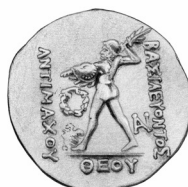
Fig. 3. Antímaco I en honor de Diodoto I (plata)