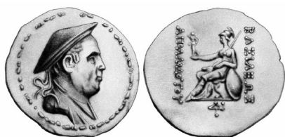
Fig. 7. Apolodoto I Apolodoto I (plata unilingüe en griego)