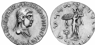
Fig. 9. Apolodoto II (plata bilingüe griego/jaroshti)