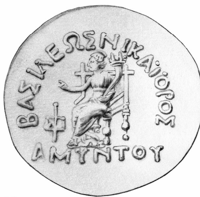
Fig. 12. Amintas (plata unilingüe en griego; doble decadracma)

(Nota: Las ilustraciones no reproducen la escala real de las piezas originales)