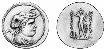
Fig.1. Demetrio I (plata)