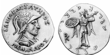
Fig. 10. Menandro I (plata bilingüe griego/jaroshti)