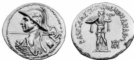
Fig. 11. Menandro I (plata unilingüe en griego)